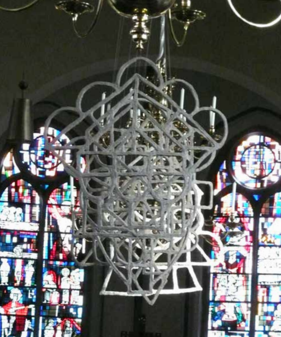
SiegelSchichtung , 2011-2015 7 Papierobjekte, 125 x 120 x 240 cm