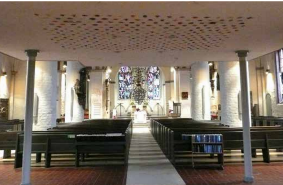
Siegel-Himmel mit 365+1 Siegel, Jahresprojekt, immerwährender Kalender Frottagen und Prägedrucke vom Linolschnitt, ca. 360 cm x 280 cm