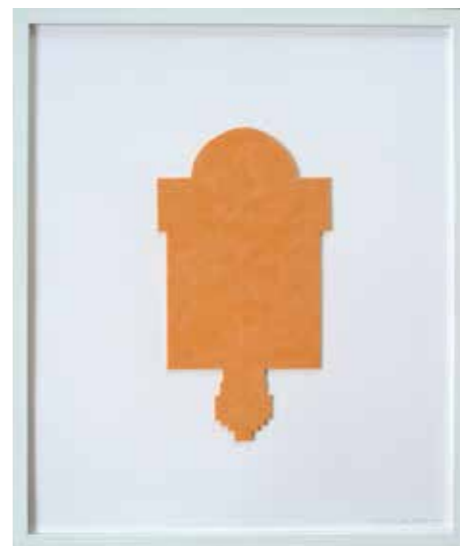
Seite 12 -15: St. Martin 1-7 , 2015 6 Vlies-Schnitte, 1 Stickbild, gerahmt, je 60 x 50 cm