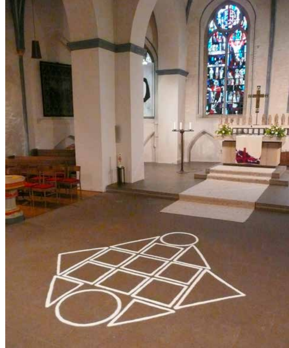
SalzSiegel 209 zum Vernissagetag, 2015 temporäre Salzstreuung, 320 x 300 cm

Siegel, Salz und Sakralraum – viele spannende Gedanken lassen sich erdenken, angeregt durch diese gar würzige und schmackhafte Mischung, die uns heute kredenzt wird!