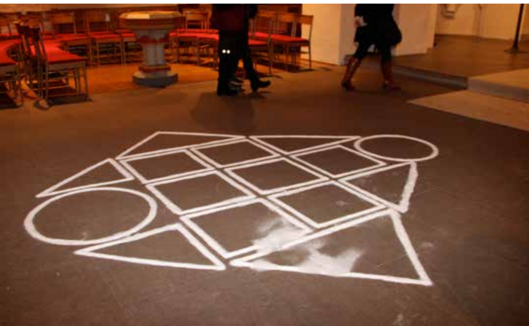
SalzSiegel 209 , am Vernissagetag betreten