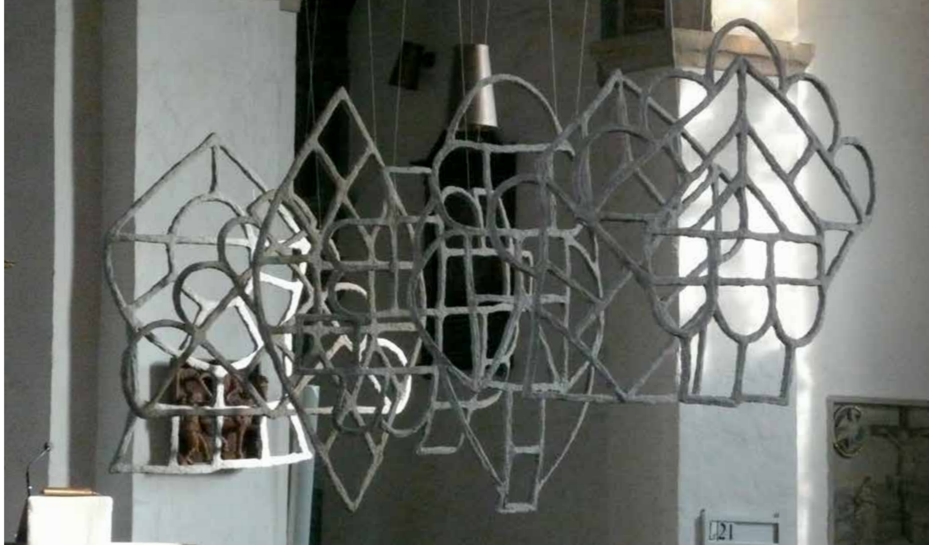
SiegelSchichtung , 2011-2015, 7 Papierobjekte, 125 x 120 x 180 cm, von vorne: Siegel 28 für 28.9., 32 für 2.10., 176 für 23.2., 238 für 25.4., 288 für 14.6., 204 für 22.3., 183 für 1.3.